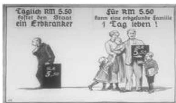
Propagande nazi contre les personnes handicapées qui coûtent chers à l'état.

Les théories décoloniales remettent en question cet héritage historique et actuel du colonialisme et de l'exploitation par les Européens blancs valides (Mendoza, 2020). Une véritable décolonisation nécessite également de prendre en compte le handicap et son intersection avec la race (source : LSE )